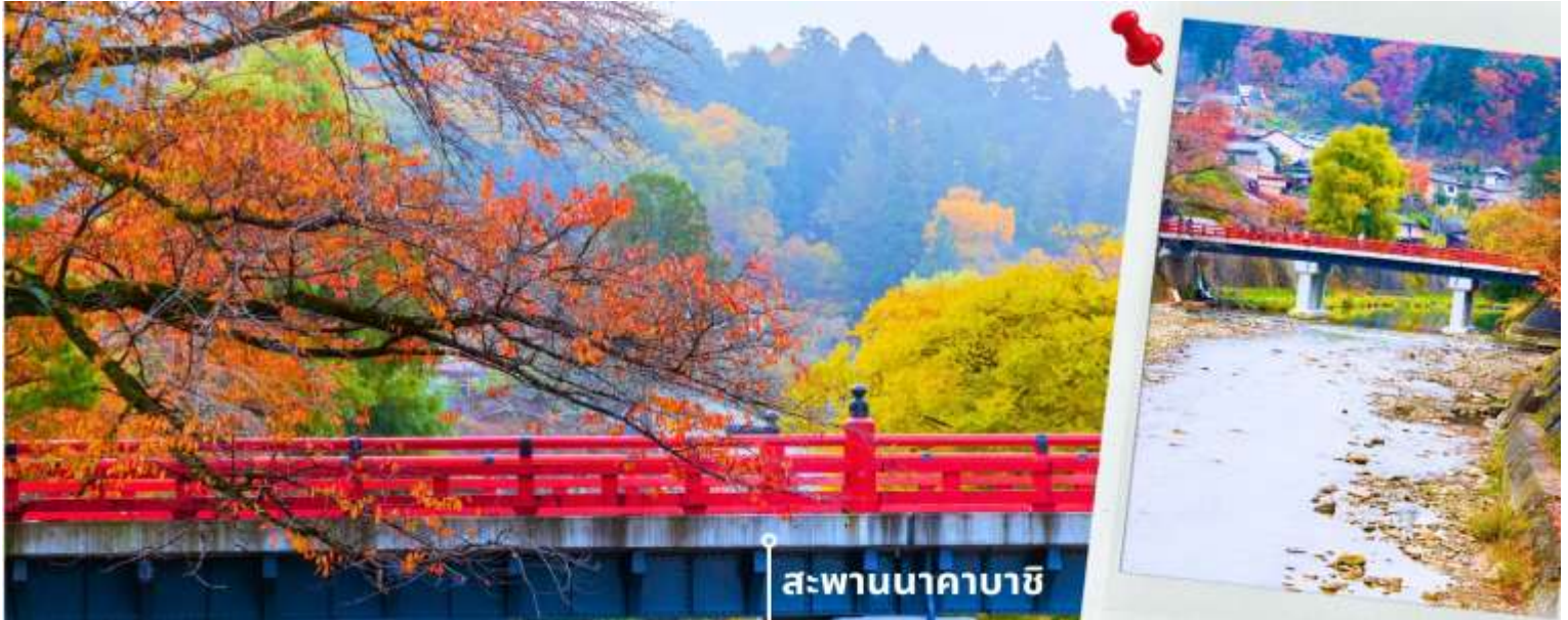
สะพานนาคาบาชิ

จากนั้นนำท่านเดินทางสู่ เมืองทาคายามา ซึ่งเป็นเมืองเล็กๆ ที่ตั้งอยู่ในจังหวัดกิฟุ ที่ห้อมล้อมไปด้วยภูเขาและธารน้ำใส พาท่านแวะถ่ายรูปและชมวิวที่ สะพานนาคาบาชิ เป็นสะพานที่สามารถเห็นได้ชัดอย่างโดดเด่นจากสีที่แดงเข้ม อีกทั้งสะพานแห่งนี้ยังถือเป็นสัญลักษณ์ที่สำคัญจุดหนึ่งของเมือง โดยเฉพาะใบไม้เปลี่ยนสีที่จะมีใบไม้สีส้มสดใสสะพรั่งอยู่รายล้อมตัวสะพาน จนกลายเป็นจุดชมวิวยอดนิยมแห่งหนึ่งของเมืองทาคายามา