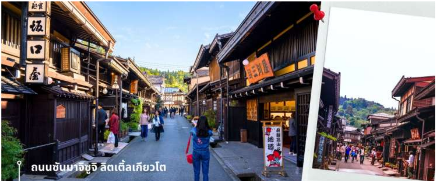
ถนนซันมาจิซุจิ ลิตเติ้ลเกียวโต

จากนั้นให้เวลาท่านเดินเล่นสัมผัสบรรยากาศกันต่อที่ ถนนซันมาจิซุจิ ซึ่งถูกขนานนามว่าเป็น “ลิตเติ้ลเกียวโต” บ้านไม้โบราณโทนสีน้ำตาลดำ เรียงรายไปตามทางเดิน มีคูน้ำอยู่รอบเมือง ปัจจุบันได้มีการปรับเปลี่ยนเป็นร้านค้า ร้านอาหาร ของที่ระลึก สำหรับนักท่องเที่ยวให้ได้เลือกชมทั้ง ผ้าแฮนด์เมด ชุดยูคาตะ ตุ๊กตาซารุโอะโอะ