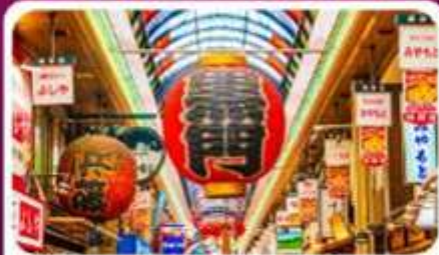
ตลาดปลาคูโรมง