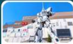
ห้างโตเวอร์ซิตี