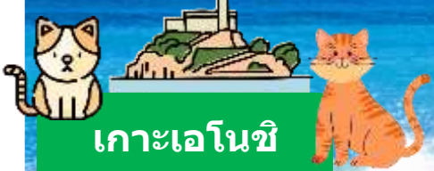
เกาะเอโนชิ