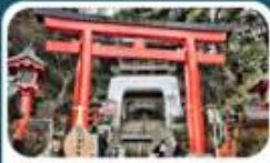
ศาลเจ้าอิเนะชิมะ