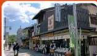
ช้อปปิ้งถนนสายชาเขียว