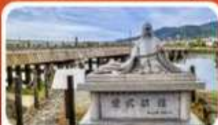
สะพานอุจิ