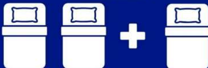
ห้องพักสำหรับสามท่าน (ที่นอนเสริม) TRIPLE BED ROOM (TRP)