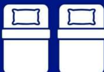
ห้องพักเตียงคู่ TWIN BED ROOM (TWN)

ห้องพักสำหรับ 1 ท่าน มีค่าใช้จ่ายเพิ่มจากค่าทัวร์