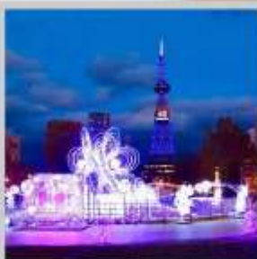
"SAPPORO WHITE ILLUMINATION"