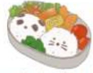
อาหารสำหรับเด็ก ( 2-11 ปี ) *วัตถุดิบขึ้นอยู่กับทาว์ราน