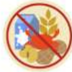
❗️ งดอาหาร / อื่นๆโปรดระบุ