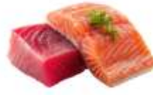
ไกทานปลาดิบ