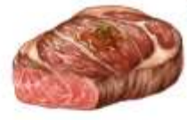
ไกทานเนื้อหมู