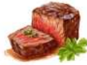
ไกทานเนื้อวัว

ขอความกรุณาแจ้งวัตถุดิบที่ท่าน แพ้หรือไม่สามารถรับประทานได้