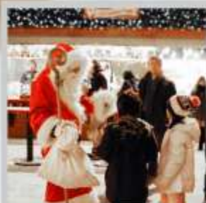
"ODORI GERMAN MARKET"