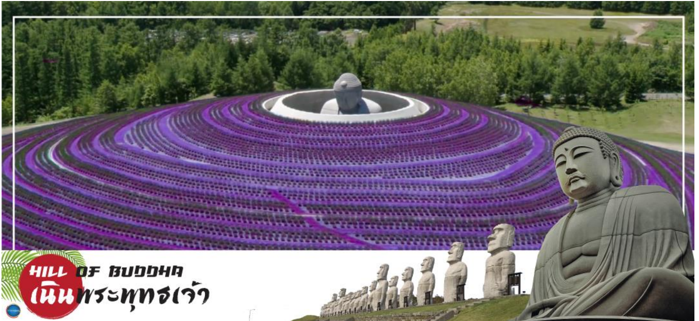
HILL OF BUDDHA เนินพระพุทธเจ้า

ตลาดปลาโนโง – เนินพระพุทธเจ้า – มิตซึยาเอะลัดท์ – ท่าอากาศยานนิวชิโตเสะ ฮอกไกโด – ท่าอากาศยานนานาชาติคันไซ โอซาก้า