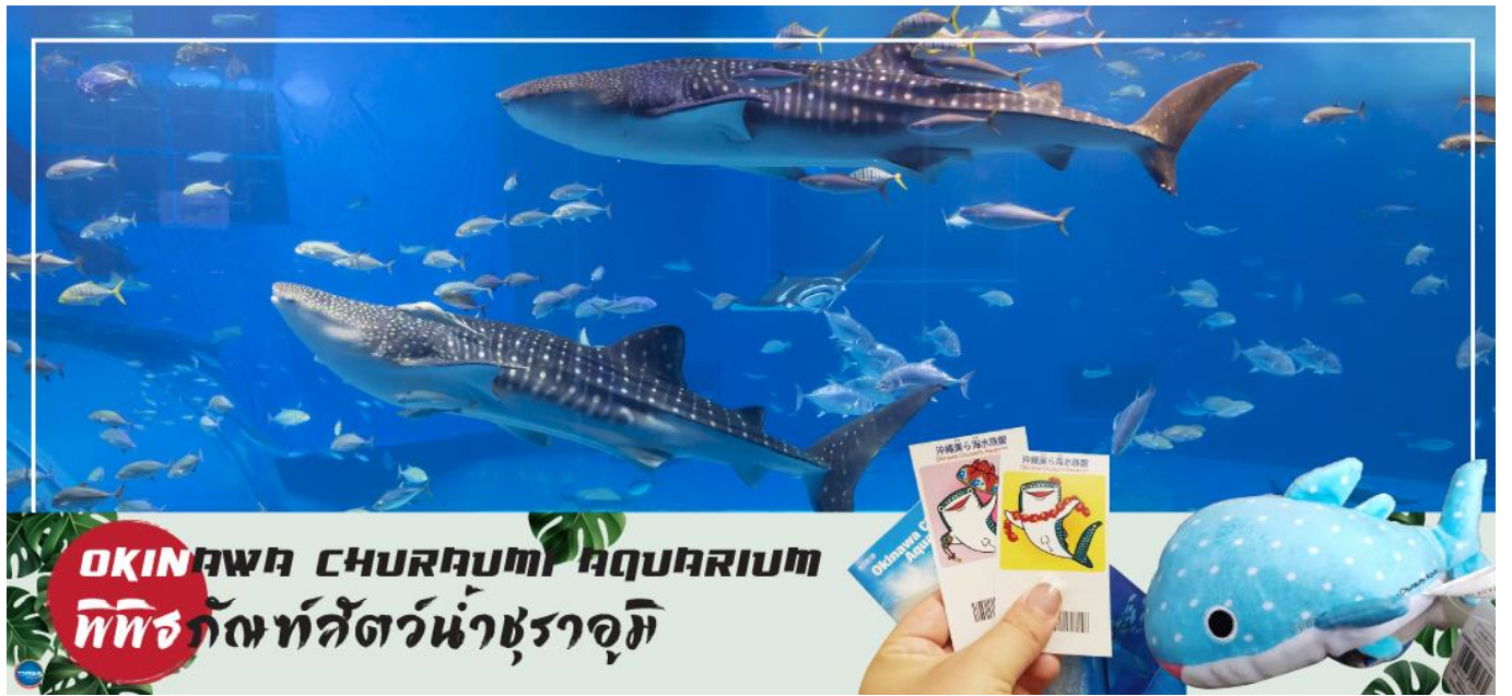
OKINAWA CHURAUMI AQUARIUM พิพิธภัณฑสัตว์น้ำชुरาอุมิ

เช้า รับประทานอาหารเช้า ณ ห้องอาหารของโรงแรม (1) นำท่านชม พิพิธภัณฑสัตว์น้ำชुरาอุมิ (OKINAWA CHURAUMI AQUARIUM) (ใช้เวลาเดินทางประมาณ 1.40 ชั่วโมง) เป็นพิพิธภัณฑสัตว์น้ำที่ดีที่สุดในประเทศญี่ปุ่น ไฮไลท์!!! ของการเยี่ยมชมพิพิธภัณฑสัตว์น้ำแห่งนี้คือแทงก์น้ำคุโรชิโอะ ซึ่งเป็นหนึ่งใน แทงก์น้ำที่ใหญ่ที่สุดของโลก ซึ่งภายในนั้นเต็มไปด้วยสิ่งมีชีวิตในทะเลแถบโอกินาวาที่หลากหลาย สัตว์น้ำที่โดดเด่นที่สุดคือฉลามวาฬยักษ์ และกระเบนราหู อีสระให้ท่านได้เพลิดเพลินกับสัตว์น้ำหลากหลายชนิด ทั้ง ปลาดาว ฉลามฉลามเสือ และฉลามวัว ปลาเรืองแสง ตลอดจนหอยต่างๆ นอกจากนี้ยังมีสระน้ำกลางแจ้งที่ตั้งอยู่ใกล้ริมน้ำซึ่งเป็นที่จัดการแสดงของโลมาแสนรู้ เต่าทะเล และพะยูน ที่จัดขึ้นเพียงไม่กี่ครั้งต่อวัน (ไม่มีค่าใช้จ่ายเพิ่มเติม แต่ต้องตรวจสอบเวลาการแสดงก่อนชมนะคะ)