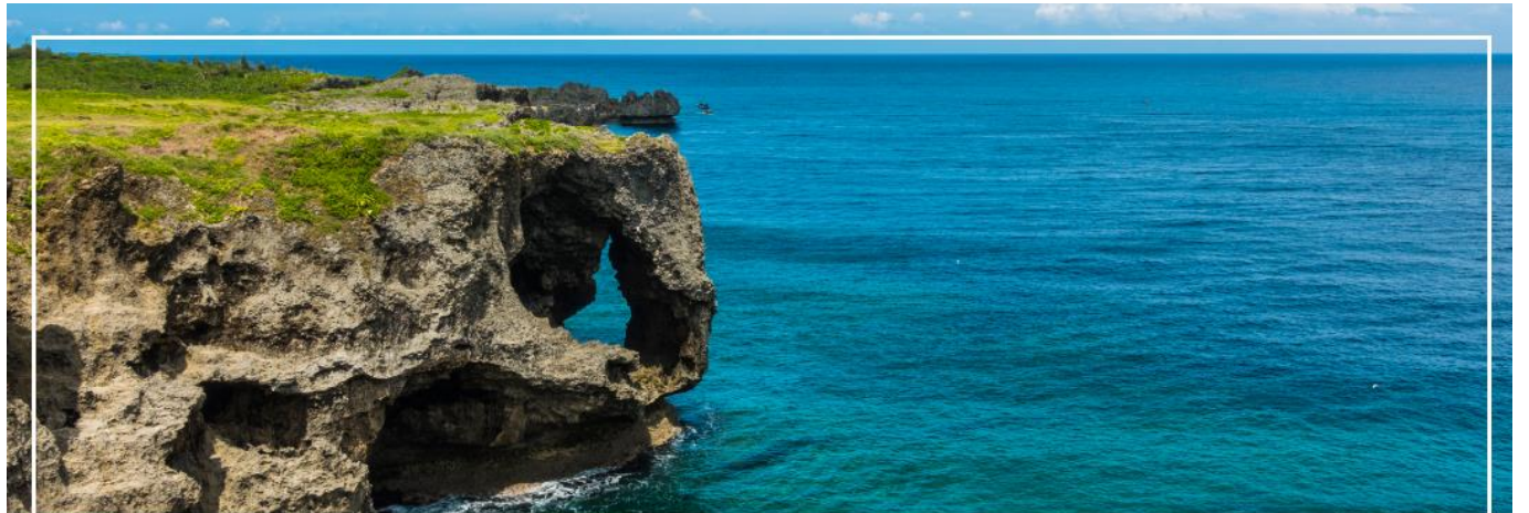
CAPE MANZAMO ผามันซาโมะ

เที่ยง รับประทานอาหารกลางวัน ณ ภัตตาคาร (2)