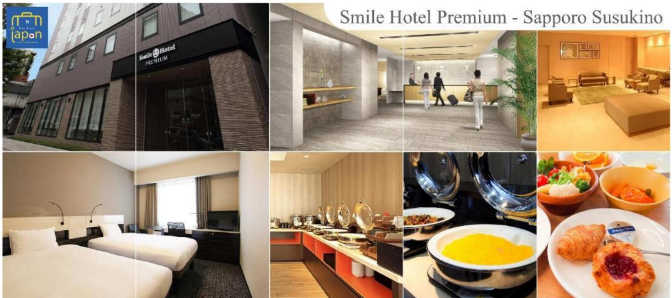
Smile Hotel Premium - Sapporo Susukino

โปรแกรมทัวร์ญี่ปุ่น HOKKAIDO LAVENDER NOBORIBETSU OTARU FURANO (XJ) 6วัน 4 คืน - รหัสทัวร์ J5224243