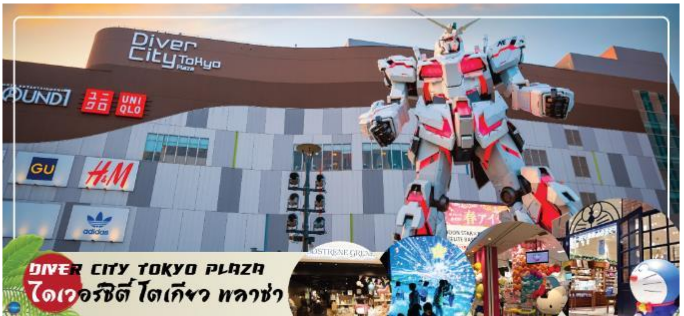
DIVER CITY TOKYO PLAZA ไดเวอร์ซิตี โตเกียว พลาซ่า

จากนั้นเดินทางสู่ ย่านโอไดบะ (Odaiba) (ใช้เวลาเดินทางโดยประมาณ 30 นาที) เมืองคือเกาะที่สร้างขึ้นไว้เป็นแหล่งช้อปปิ้ง และแหล่งบันเทิงต่างๆ ในอ่าวโตเกียว ได้รับการปรับปรุงให้มีชื่อเสียงและเป็นที่ยอมรับในช่วงหลังของปี 1990 นอกจากนี้มีสถาปัตยกรรมที่สวยงามตั้งอยู่มากมายแล้ว แต่ก็มี