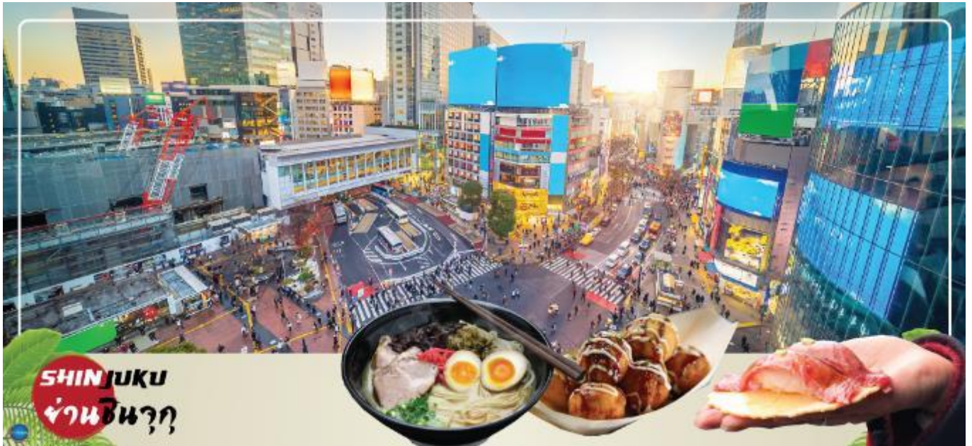
SHINJUKU ย่านชินจุกุ

นำท่านช้อปปิ้ง ย่านชินจุกุ (Shinjuku) ให้ท่านอิสระและเพลิดเพลินกับการช้อปปิ้งสินค้ามากมาย ทั้งเครื่องใช้ไฟฟ้า กล้องถ่ายรูปดิจิตอล นาฬิกา เครื่องเล่นเกม หรือสินค้าที่จะเอาใจคุณผู้หญิงด้วย กระเป๋า รองเท้า เสื้อผ้า แบรินด์เนม เสื้อผ้าแฟชั่นสำหรับวัยรุ่น เครื่องสำอางยี่ห้อดังของญี่ปุ่นไม่ว่าจะเป็น KOSE, KANEBO, SK II, SHISEDO และอื่นๆ อีกมากมาย ห้ามพลาด!!! จุดเช็คอินแห่งใหม่ ของชาวโซเชียล นั่นก็คือ เมวยักษ์ 3 มิติ ที่โพลันจอลแอลอีดีมีขนาดมหึมา จมมีความโค้งขนาด 154 ตารางเมตร (1,664 ตารางฟุต) เสียงที่ออกจากลำโพงคุณภาพเกรดดี ความละเอียดภาพระดับ 4K ถือเป็นเทคโนโลยีระดับสูง ที่ให้ภาพเสมือนจริงปรากฏเป็นภาพแมวเหมียวเดินเล่นไปมาอยู่เหนือ กรุงโตเกียว นอกจากเมวยักษ์แล้ว ท่านยังสามารถรับชมโฆษณาต่างๆ ที่ถูกครีเอทให้เป็นภาพ 3 มิติ ผ่านจอแอลอีดีนี้ ไม่ว่าจะเป็น แพนด้า, รองเท้าไนกี้, น้องหมา Pompompurin, จานบิน UFO แม้แต่หุ่นยนต์เครื่องดูดฝุ่น ท่านสามารถรับชมและเก็บภาพได้ตามอัธยาศัย