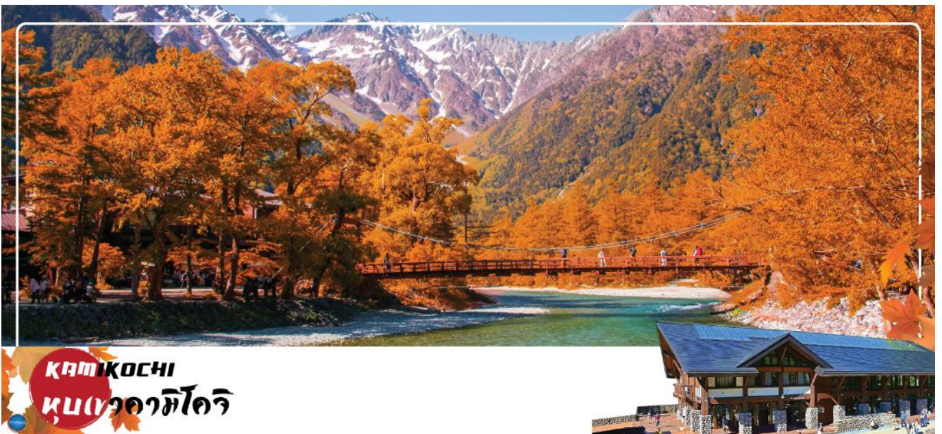
KAMIKOCHI หุบเขาคามิโคจิ

รับประทานอาหารกลางวันอิสระตามอัธยาศัย ณ ถนนซันมาจิซุจิ