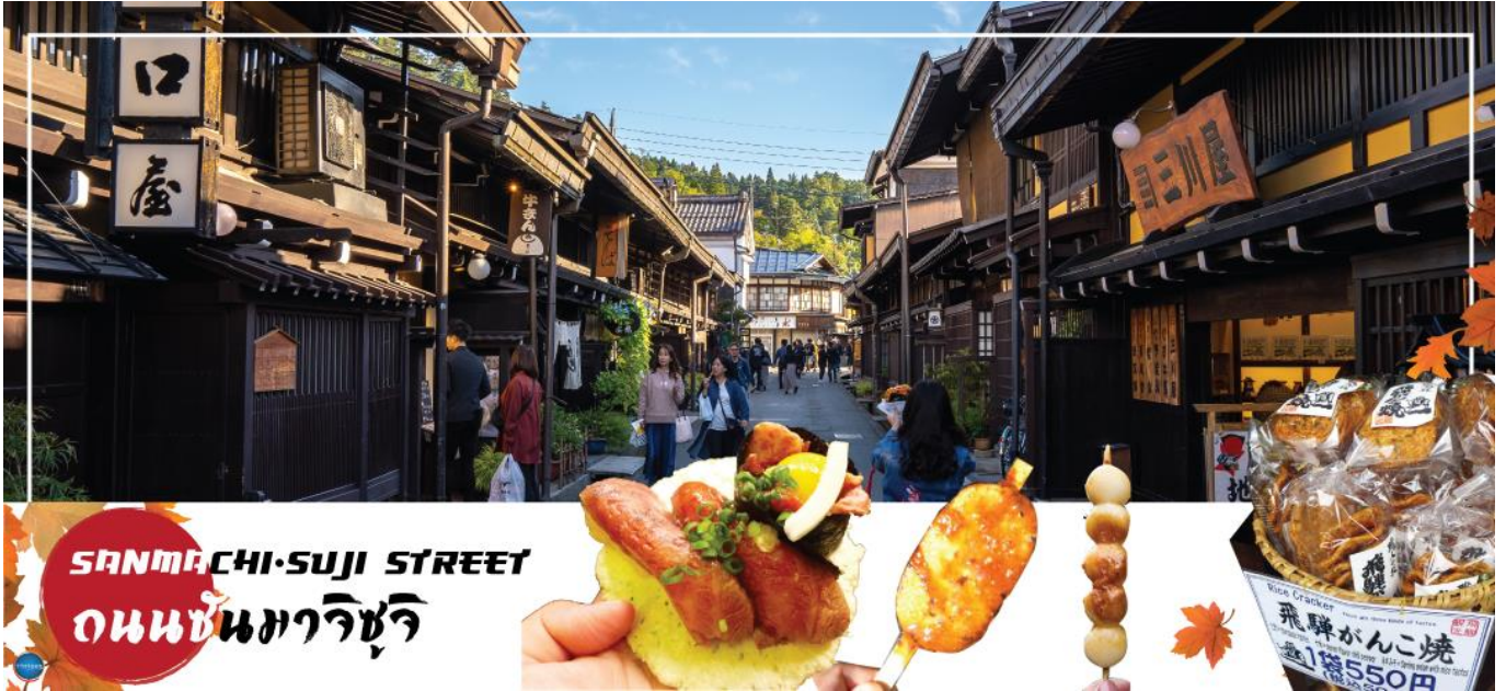
SANMACHI-SUJI STREET ถนนซันมาจิซุจิ

เมืองนาโกย่า - เมืองทาคายามะ - ย่านซันมาจิซุจิ - เมืองนากาโน่ - คามิโคจิ - สะพานกัปปะ - เมืองมัตสึโมโตะ - ปราสาทมัตสึโมโตะ (ด้านนอก)