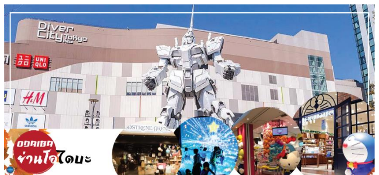
อภิมหานคร ห้างโอไดบะ

บันเทิงต่างๆ ในอ่าวโตเกียว ได้รับการปรับปรุงให้มีชื่อเสียงและเป็นที่ยอมรับในช่วงหลังของปี 1990 นอกจากนี้มีสถาปัตยกรรมที่สวยงามตั้งอยู่มากมายแล้ว แต่ก็ยังคงความเป็นธรรมชาติไว้ด้วยความอุดมสมบูรณ์ของพื้นที่สีเขียว ไดเวอร์ซิตี โตเกียว พลาซ่า (Diver City Tokyo Plaza) เป็นห้างดังอีกห้างหนึ่ง ที่อยู่บนเกาะ โอไดบะ จุดเด่นของห้างนี้ก็คือ หุ่นยนต์กันดั้ม ขนาดเท่าของจริง ซึ่งมีขนาดใหญ่มาก ในบริเวณห้าง อีซระช้อปปิ้งตามอัธยาศัย