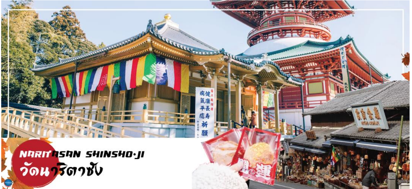
NARITASAN SHINSHO-JI วัดนาริตะชิน

เมืองนาริตะ – วัดนาริตะชิน – ถนนโอมโตะซังโตะ – ย่านโอไดบะ – ห้างไดเวอร์ซิตี – ท่าอากาศยานนานาชาตินาริตะ – ท่าอากาศยานสุวรรณภูมิ