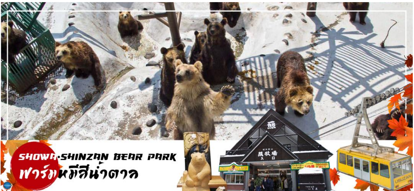
SHOWA-SHINZAN BEAR PARK พาร์คนหมีสีน้ำตาล

ทะเลสาบโทยะ – ภูเขาไฟโชวะ (นั่งกระเช้า) – ศูนย์อนุรักษ์พันธุ์หมีสีน้ำตาล – เมืองโจซังเค – ชมสะพานแขวนฟุตามิ สิริบาชิ – สวนโจซังเคเกินเซน – เมืองซัปโปโร – ย่านซูซูกิโนะ