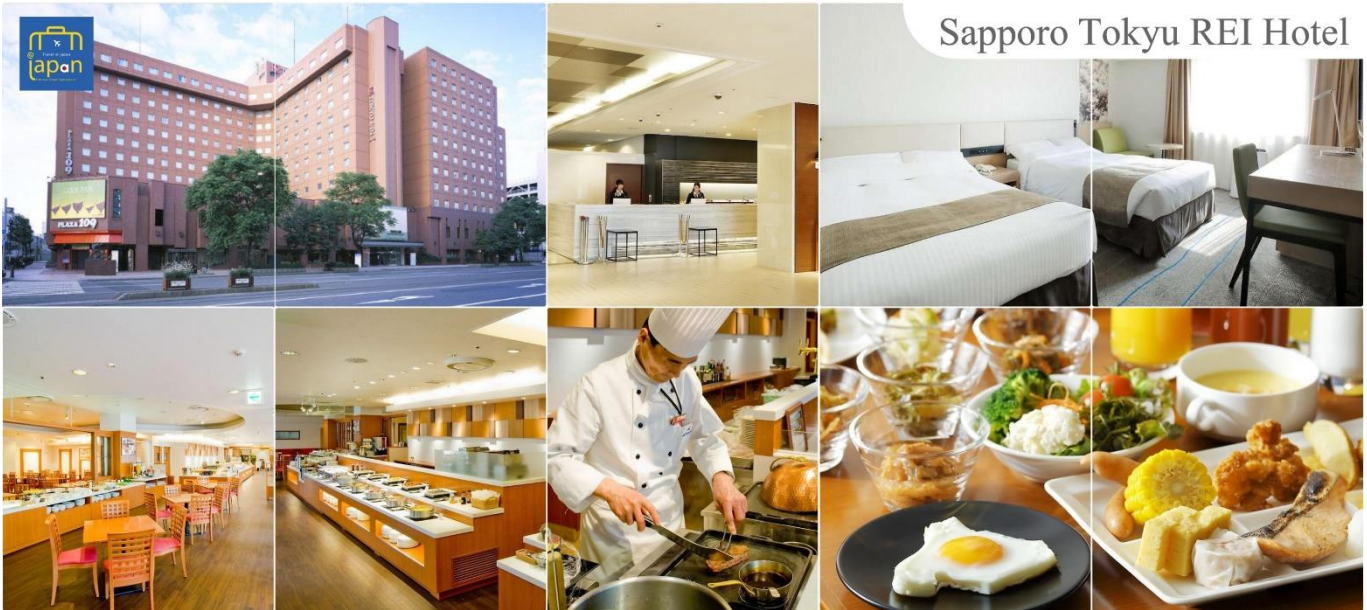
Sapporo Tokyu REI Hotel

วันที่ห้า เมืองซัปโปโร – ดิวตี้ฟรี – เมืองโอตารุ – คลองโอตารุ – พิพิธภัณฑ์กล่องดนตรี – เมืองซัปโปโร – มหาวิทยาลัยฮอกไกโด – ถนนช้อปปิ้งทานุกิโคจิ