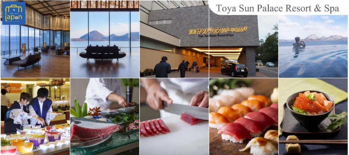
Toya Sun Palace Resort & Spa

TOYA SUN PALACE RESORT & SPA หรือเทียบเท่าระดับเดียวกัน (โรงแรมที่ระบุในรายการทัวร์ เป็นเพียงโรงแรมที่น่าเสนอเบื้องต้นเท่านั้น ซึ่งอาจมีการเปลี่ยนแปลง แต่โรงแรมที่เข้าพัก จะเป็นโรงแรมระดับเทียบเท่ากัน)