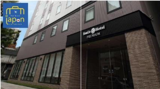
Smile Hotel Premium - Sapporo Susukino

รับประทานอาหารเย็น ณ ภัตตาคาร (4) พิเศษ!!! เมนู นูฟเฟดซามู + ซามู SMILE HOTEL PREMIUM - SAPPORO SUSUKINO หรือเทียบเท่าระดับเดียวกัน ที่พัก HOTEL CRESCENT ASAHIKAWA หรือเทียบเท่า (โรงแรมที่ระบุในรายการทัวร์เป็นเพียงโรงแรมที่ นำเสนอเบื้องต้นเท่านั้น ซึ่งอาจมีการเปลี่ยนแปลง แต่โรงแรมที่เข้าพักจะเป็นโรงแรมระดับเทียบเท่ากัน)