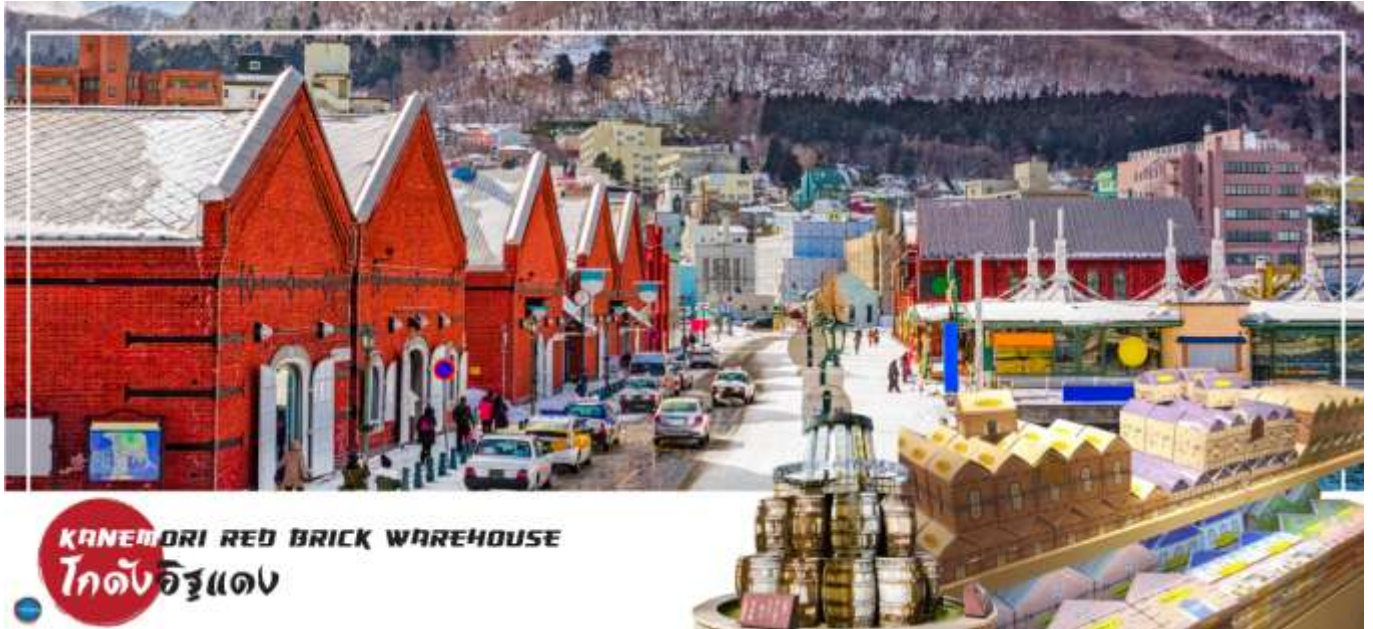
KANEMORI RED BRICK WAREHOUSE โกดังอิฐแดง

เมืองฮาโกดาเตะ – ตลาดเช้าฮาโกดาเตะ – โกดังอิฐแดง – ย่านเมืองเก่าโมโตมาชิ – ป้อมโกเรียวกาคู (เช้าชม) – ทะเลสาบโทยะ – ออนเซน