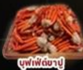
บุฟเฟ่ต์ซาซิมิ