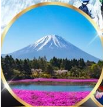
ฟูจิชิบะซากุระ