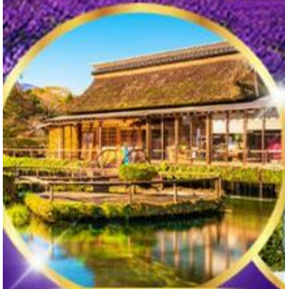
หมู่บ้านไอชิโนะ อักโก

อิสระท่องเที่ยว 1 วันเต็ม "วันอิสระเลือกซื้อ Tokyo Disney"