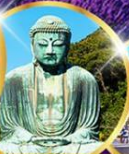
พระใหญ่โตบุทสึ