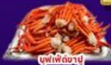
บุฟเฟ่ต์ซาปู