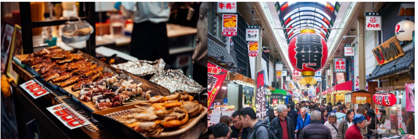
เที่ยง อิสระอาหารตามอริยาศัยเพื่อสะดวกแก่การท่องเที่ยว

นำท่านเดินทางสู่ ตลาดคูโรมง โอซาก้า (KUROMON ICHIBA MARKET) เป็นตลาดที่มีชื่อเสียงและเก่าแก่มากที่สุดแห่งหนึ่งของเมืองโอซาก้า จนได้รับสมญานามว่าเป็น ครัวของโอซาก้า (OSAKA'S KITCHEN) กันเลยทีเดียว มีบรรยากาศภายในเป็นทางเดิน ARCADE เล็กๆทอดยาวประมาณ 600 เมตร 2 ข้างทางจะเต็มไปด้วยร้านค้าต่างๆกว่า 160 ร้านค้า ขายทั้งของสด และแบบพร้อมทาน มีของกินเล่นและอาหารพื้นเมืองมากมายหลายชนิดให้ได้ชิม นอกจากของสดแล้วในตลาดก็จะมีพวกร้านขายของกึ่งกึ่งแทรกตัวอยู่บ้าง เช่น อุปกรณ์ทำครัว เสื้อผ้ากระเป๋าดังๆ แต่ที่น่าสนใจอีกอย่างหนึ่งของตลาดนี้ ก็คือพวกร้านขายขนมแบบท้องถิ่น ที่มีทั้งแบบแพคเกจดูบ้านๆ อินดี้ๆหน่อยซึ่งอาจจะไม่ได้เห็นที่อื่นๆ ไปจนถึงแบบที่มีขายทั่วไป อย่างเช่นพวก KITKAT กลูลิโกะ รสต่างๆ