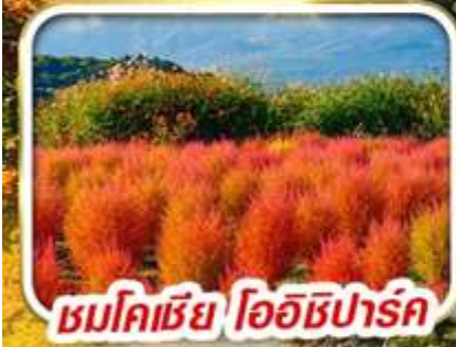
ชมโคเซียว โออิชิปาร์ค

AUTUMN ล่องเรือชมใบไม้เปลี่ยนสี (เที่ยวเต็ม)