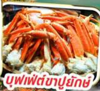
บุฟเฟ่ต์ขาปูยักษ์