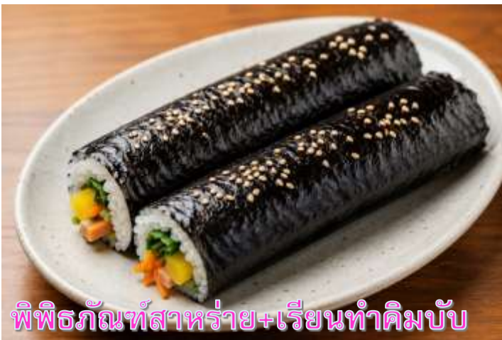
พิพิธภัณฑ์สำหรับวัย+เรียนทำคิมบับ

เดินทางสู่ พิพิธภัณฑ์สำหรับวัย ที่บอกเล่าเรื่องราว เกี่ยวกับสำหรับวัย อาหารชั้นยอดของเกาหลี ที่กลายเป็นส่วนหนึ่งในวัฒนธรรมการประกอบอาหารของเกาหลี เรียนการทำคิมบับ เป็นกิจกรรมวัฒนธรรมเกาหลีที่เปิดโอกาสให้ได้เรียนรู้การทำอาหารประจำชาติ ร่วมกิจกรรมใส่ชุดฮันบกหลากหลายที่มีไว้ให้เลือก พร้อมถ่ายรูปกับฉากและพริอบที่เตรียมไว้เก็บเป็นที่ระลึกว่าครั้งหนึ่งเราได้เคยมาเยือนดินแดนที่มีวัฒนธรรมหลากหลายเช่นนี้