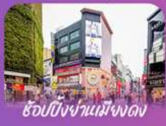
ช้อปปิ้งจ่านเมียงดง