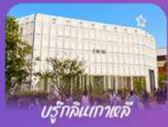
บริคไลน์เกาตลึ