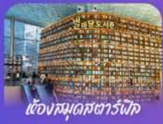
ตึกมดสารพัด

เก็บทุกไฮไลท์ ในกรุงโซล ตั้งแต่ความงดงามของ พระราชวังเคียงบ็อก ชมวิวสุดอลังการที่ ดึงดูดสายตา โซลสกาย (รวมค่าลิฟต์ขึ้นดึก) สนุกสุดเป็นยี่สิบ ส่วนสนุกลือลือระดับโลก (รวมค่าบัตรเครื่องเล่น) เพลิดเพลินไปกับโลกใต้ทะเล ลิตเติ้ล อควาเรียม (รวมค่าบัตรเข้าชม) เช็กอินแลนด์มาร์กสุดฮิตอย่างห้องสมุดสตาร์ฟิช โคเชกมอลล์ เดินเล่นย่านฮิป บริคอินทาร์นลี่ ซองชุลม และช้อปปิ้งซัมเมอร์ซอซ สูดฟีล ย่านเมืองคยองและองคต