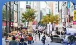
ฮ้อปบิงจ่านเมียงดง