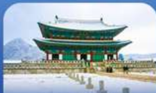
พระราชวังเด็งงก

สัมผัสเสน่ห์ทุกฤดูหนาวเล่นที่ระบบจัดเต็มทีสกีรีสอร์ท พร้อมกิจกรรมสุดมันส์ถึงที่พัก สโนว์บอร์ด และสโนว์สไลด์ ก่อนสัมผัสไฮไลท์สุดว้าว ณ ทะเลสาบฮันจงง ลานน้ำแข็งธรรมชาติ ขนาดใหญ่ที่เปิดให้สนุกกับการคดปลาน้ำแข็ง นินจากระโดด และลากเลื่อน เพียงมีละครั่งทำมัน พลาดไม่ได้กับการช้อปปิ้งในจตุรัสเมียงดงและองแด เก๋ขงสนุก ช้อป ฟิน ครบทุกสไตล์สินทรัพย์เดียว