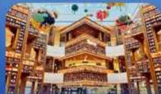
เคียงมดสตาร์นิค