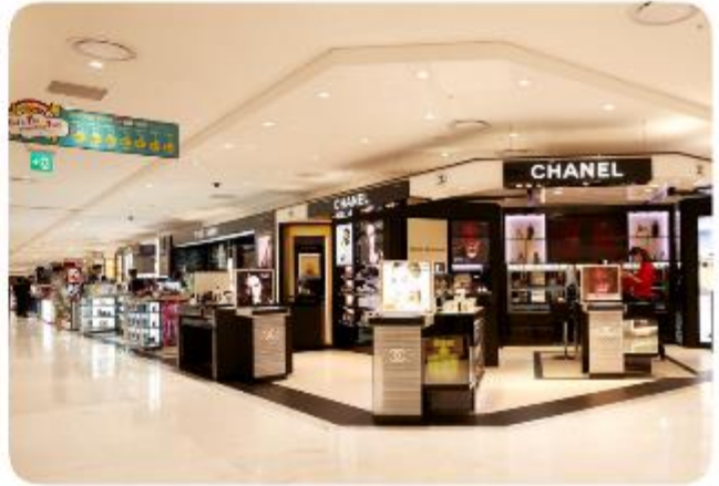
ทัศนียภาพโดยรอบ

LOTTE DUTY FREE BUSAN ศูนย์รวมสินค้าปลอดภาษีที่ใหญ่ และดีที่สุดในเมืองปูซาน ที่รวบรวมสินค้าแบรนด์เนมของทั้งจากเกาหลี และจากทั่วทุกมุมโลกกว่า 200 แบรินด์ มารวมไว้เพื่อให้ทุกท่านได้เลือกซื้อในราคาพิเศษที่ปลอดภาษี ทั้งยังมีของขวัญ ของที่ระลึกพิเศษต่าง ๆ ของเกาหลีมีไว้จำหน่ายเป็นของฝากในการมาเยือนเกาหลีอีกด้วย