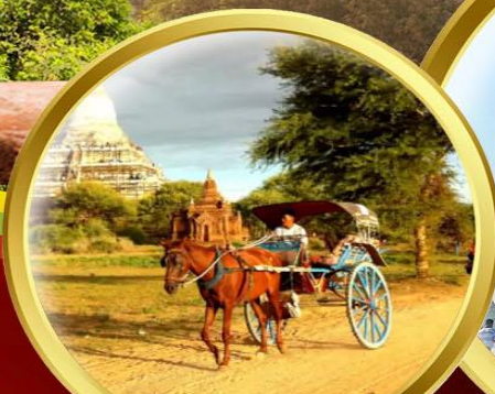
นั่งรถม้าชมเมืองพุกาม