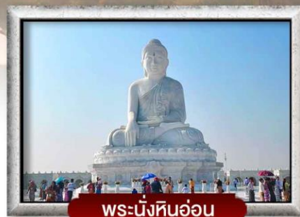
พระนั่งหินอ่อน