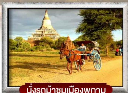
นั่งรถม้าชมเมืองพุกาม