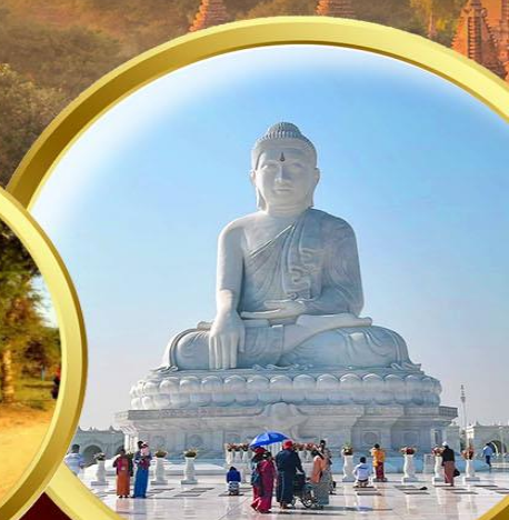
พระนั่งหินอ่อน