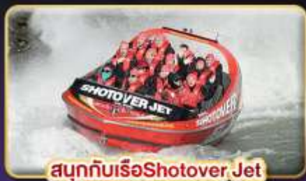
สนุกกับเรือ Shotover Jet