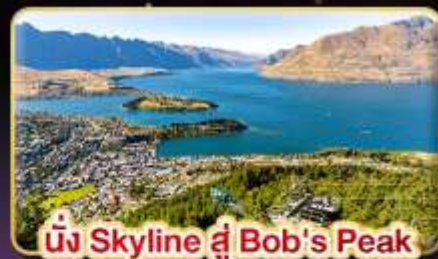
นั่ง Skyline สู่ Bob's Peak