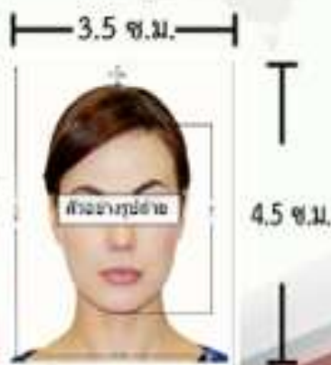
ตัวอย่างขนาดรูปถ่ายที่ตรงตามสถานทูตกำหนด

สแกนรูปถ่ายสี ขนาด 3.5x4.5 ซม. 2 รูป ที่มีพื้นหลังสีขาว (ไม่เกิน 6 เดือน) ห้ามใส่แว่น ห้ามสวมคอนแทคเลนส์ และเครื่องประดับต่างๆ รูปถ่ายต้องมีความคมชัดของภาพสูง ผมไม่ปิดคิ้ว รวบผมเปิดใบหน้า เห็นแนวตาผู้สมัครชัดเจน และห้ามตกแต่งภาพใดๆทั้งสิ้น ความยาวของใบหน้าตั้งแต่ศีรษะจรดคาง อยู่ระหว่าง 3-3.5 เซนติเมตร ความกว้างของใบหน้า 2.5 เซนติเมตร แต่ไม่เกิน 3 เซนติเมตร