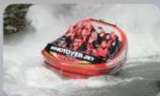
สนุกกับเรือ Shotover Jet