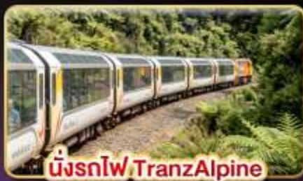
นั่งรถไฟ TranzAlpine