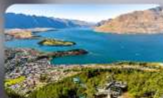
นั่ง Skyline สู่อ Bob's Peak