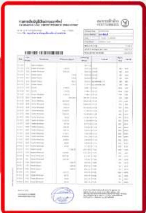
ตัวอย่าง Bank Guarantee ที่ผู้สมัครต้องเตรียมการ