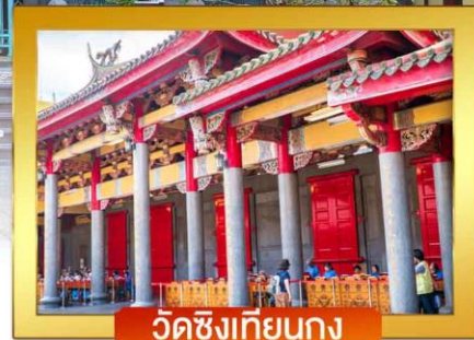
วัดชิงเทียนกง