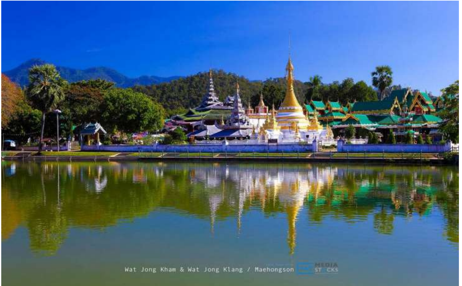
Wat Jong Kham & Wat Jong Klang / Mae Hong Son

บนความสูงกว่า 1,600 เมตร นับเป็นทุ่งดอกบัวตองที่ใหญ่และสวยที่สุดในประเทศไทย - การจำหน่ายผลิตภัณฑ์ OTOP ของจังหวัดแม่ฮ่องสอน - การจำหน่ายพืชผลทางการเกษตรบริเวณทุ่งดอกบัวตอง (หมายเหตุ : ดอกบัวตองบานช่วงปลายเดือนตุลาคม-ต้นเดือนธันวาคมของทุกปี ทั้งนี้เป็นเพียงการคาดการณ์เท่านั้น ขึ้นอยู่กับสภาพภูมิอากาศ และขอสงวนสิทธิ์ไม่ปรับเปลี่ยนรายการอื่นทดแทนเนื่องจากเส้นทางที่เดินทางไปชมทุ่งบัวตองห่างไกลจากสถานที่เที่ยวอื่น)