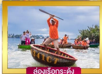
ล่องเรือกระทง