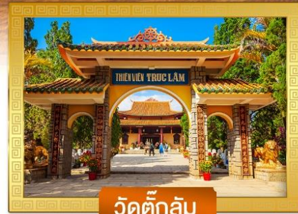
วัดตักกิม