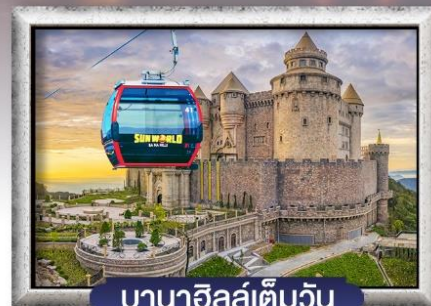
บาน่าฮิลล์เต็มวัน