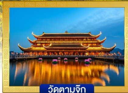
วัดตามจุก